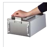
Arretierung des Beutelspenders durch Einrasten und zusätzliche, unsichtbare Verklebung