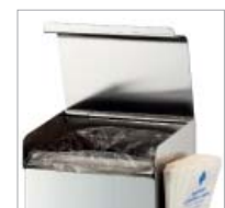
Eingelegter Abfallbeutel bei geschlossener Klappe von außen nicht sichtbar