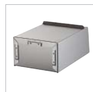
Drei Einstecklaschen am Behälterboden zur alternativen Befestigung des Beutelspenders

Passende Hygienebeutel aus Kunststoff oder Papier sowie passende Abfallbeutel finden Sie in unserem aktuellen Katalog mit den derzeit gültigen Preisen oder auf unserer Homepage www.air-wolf.de